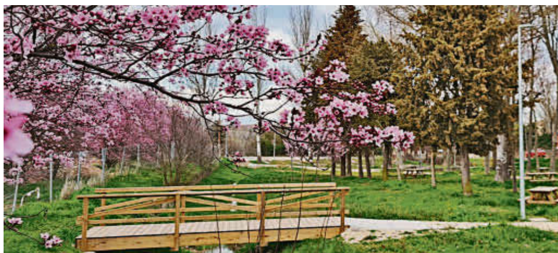
Imagen del remozado parque Lazarillo de Tormes, acondicionado con fondos FEDER.

Además de estas reglas del ABCDE, los dermatólogos hablan de otra señal importante que es la del ‘patito feo’. “Una persona que tiene muchos lunares parecidos y, de repente, uno es diferente a los demás. Ese lunar que es distinto es el que te pone en alerta”, explica el dermatopatólogo del Hospital de Salamanca Ángel Santos-Briz.